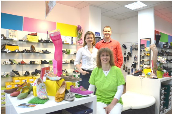
Ihr Team von Tremi Laufgut

Wir freuen uns auf Ihren Besuch in unseren Geschäftsräumen!